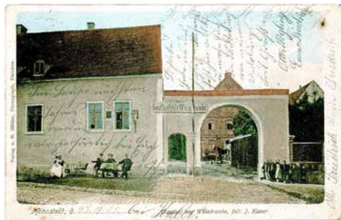
Höhnstedt: Gasthof „Zur Weintraube“

Unsere Postkarte, die 1903 versendet wurde, führt uns in die Weinbauregion nach Höhnstedt und zeigt uns den alten Gasthof „Zur Weintraube“.