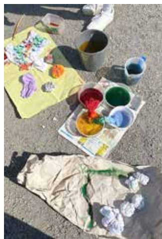
Batiken im Camp