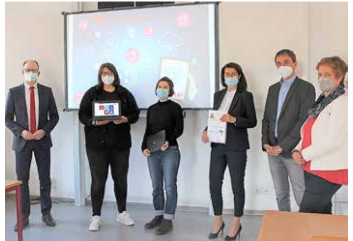
Übergabe des Schecks