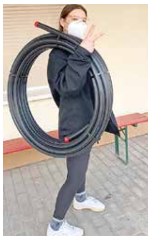
Materialtransport für Hula-Hopp-Reifenbau

entsprechend der aktuellen Lage haben wir unsere Projekte ins Freie verlagert. Wir haben Körbe geflochten, Textilien gebatikt, mit Farben und Papier gebastelt und den „Hullertrend“ für uns entdeckt. Dafür sind eigene HulaHoop Reifen gebaut und gestaltet worden. Nun arbeiten wir an der Technik, Variationen und Ausdauer HulaHoop drehen.