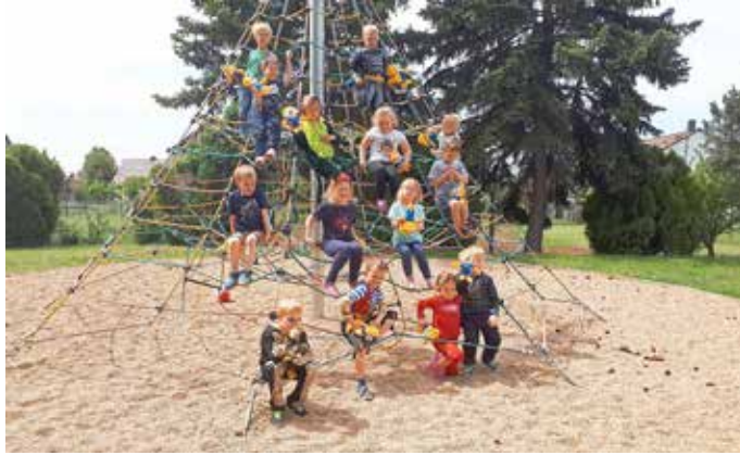
Kinder der Kita Buratino