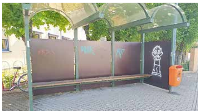
Bushaltestelle Richtung Langenbogen

Die großflächigen Holzplatten in unseren Bushaltestellen an der Eislebener Str. in Richtung Halle und in Richtung Langenbogen sollen angemessen künstlerisch gestaltet und damit aufgewertet werden.