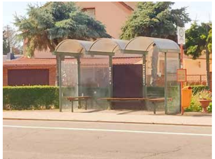
Bushaltestelle Richtung Halle

Der Kreativität sind keine Grenzen gesetzt.