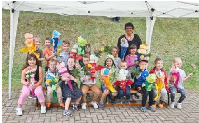
ABS-Raupen der Kita Kinderland

Am 02.07.2021 war es so weit: die ABC-Raupen der Kita Kinderland in Salzmünde feierten ihr Zuckertütenfest.