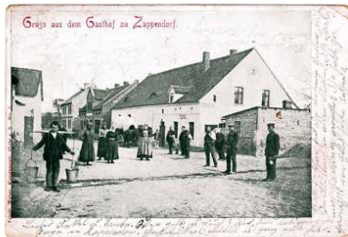
Zappendorf „Gasthof zu Zappendorf“

Unsere Postkarte, die 1902 versendet wurde, zeigt uns den „Gasthof zu Zappendorf“.