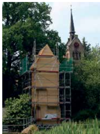
Eingerüsteter Traforturm in Wils

Nach der erfolgreichen Umwandlung des Traforturms Zellewitz in einen Artenschutzurm im Jahre 2020 wird nun in diesem Jahr in Wils bei Schochwitz ein ähnliches Projekt umgesetzt. Die Umwandlung des ehemaligen Traforturms zu einem Artenschutzurm erfolgt durch den Verband Artenschutz in Franken® und den Naturpark Unteres Saaletal e. V., mit Unterstützung der Gemeinde Salzatal und der Deutschen Postcode Lotterie . Damit wird eine weitere lebendige „ Stele der Biodiversität “ geschaffen. Die Maßnahmen zur Neugestaltung des Turmes wird seit dem 14. Juni realisiert.