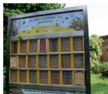
Wildbienenwand in Schochwitz

in Franken® realisiert, mit dem wir schon seit vorigem Jahr weitere Projekte im Umweltbildungs- und Artenschutzbereich umsetzen. Die Maßnahme dient sowohl der Umweltbildung als auch dem Artenschutz. Die Naturwerkstatt wird die Wildbienenwand in Zukunft im Rahmen ihrer Aktivitäten nutzen.