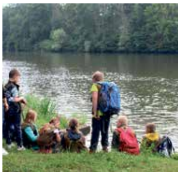
Schüler der Grundschule in Plötzkau

Eine ähnliche Entdeckerwesten-Wanderung fand am 2. Juli mit Schülern der 4. Klasse der Grundschule in Plötzkau statt. Die Kinder waren zum Startpunkt im Bernburger Ortsteil Neuborna mit dem Fahrrad gekommen und an die Exkursion schloss sich ein Badevergnügen im dortigen Freibad „Saaleperle“ an.