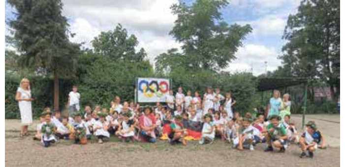
„Olympioniken“ der Grundschule Beesenstedt

Während der zweitägigen Stationsarbeit entstand für jeden eine Projektmappe, die alle wichtigen Informationen enthielt und mit nach Hause genommen werden konnte. Ein antikes Sportfest mit Fackellauf, Hymne und olympischem Feuer bildete den Abschluss unserer kleinen Olympiade. Verkleidet mit den selbst hergestellten Sachen wurden beim Speer-, Stein- und Zielwurf, Wagenrennen sowie Hindernis- und Waffenlauf die Kräfte gemessen. Und, wie in der Antike üblich, erhielt der Sieger einen Lorbeerkranz.