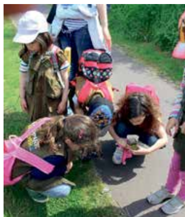
Kita „Nesthäkchen“ auf Exkursion

am 3. Juni fand die erste diesjährige Exkursion mit den Entdecker-Westen statt. Kinder der Bernburger Kita „Nesthäkchen“ marschierten bei schönstem Wanderwetter in Begleitung eines Naturparkmitarbeiters durch die Auenlandschaft südlich von Bernburg. Die vielfältigen Entdeckungen, die durch die Nutzung der in den Westen enthaltenen Utensilien, wie Lupe oder Lupenbecher, möglich waren, ließen die Wanderung für die Vorschulkinder zu einem großen Erlebnis werden. So wird die Kita Nesthäkchen unser Exkursionsangebot auch in Zukunft nutzen.