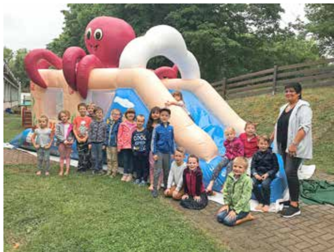
Die „Fast-Erstklässler“ vor der gesponserten Hüpfburg