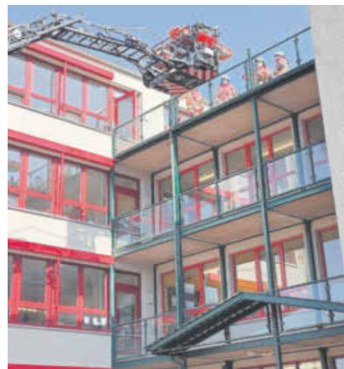
spektakuläre Rettungsaktion

Viele Spaß bereitete uns die Löschstation auf dem Schulhof, wo wir schnell reagieren mussten.