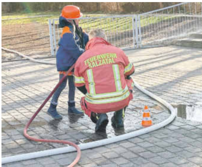
An der Löschstation