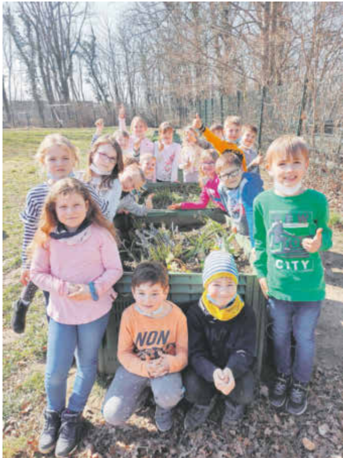
Die Kinder der 1. Klasse am Hochbeet mit den eingepflanzten Frühblühern

Nach einem anschaulichen Vortrag über die Pflanzen, gab es von Frau Klimt Frühjahrsblüher als Geschenk. In der noch kalten Zeit schmückten sie den Klassenraum und mit Beginn der wärmeren Tage wurden sie von den kleinen Händen in das Hochbeet der Schule gepflanzt.